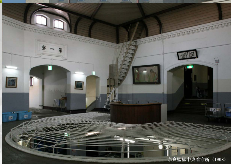
奈良監獄中央看守所 (1908)